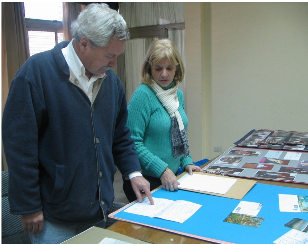
Los autores en pleno trabajo de selección del material

nicaturas, ingeniería. Además, cabe señalar que muchos docentes han logrado títulos por ejemplo Licenciaturas o maestrías, entre otras en Matemática e Inglés, en otras universidades, lo que redunda en beneficio de la facultad. Por otra parte contamos con una infraestructura con laboratorios de alta tecnología, una planta piloto que para muchos es el orgullo de esta facultad.